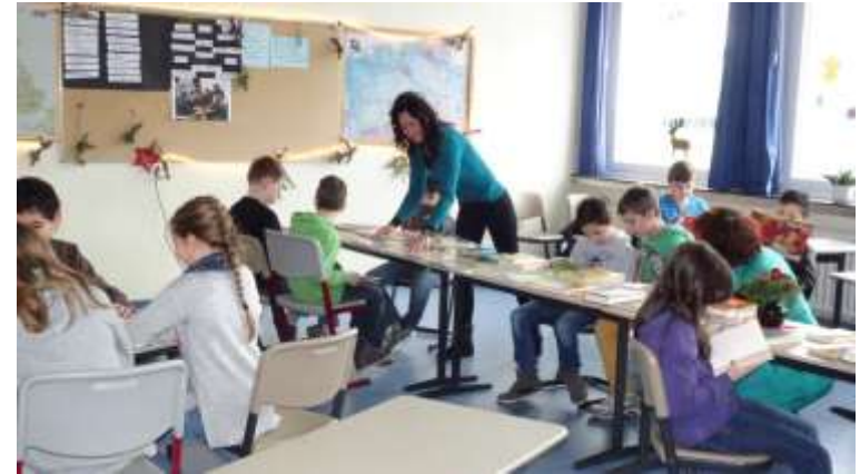
Blick in die Klassenräume und unsere Mensa