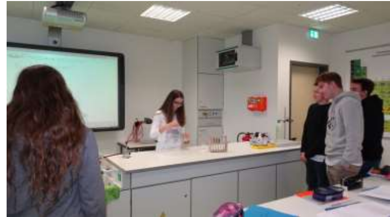
Physik- und Chemieunterricht